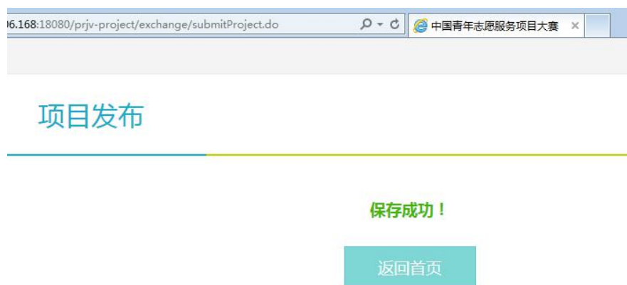
图 14 项目发布成功

第七步：点击“保存”按钮，页面提示“保存成功”，则表示项目申报内容成功录入（如图 14 所示）。