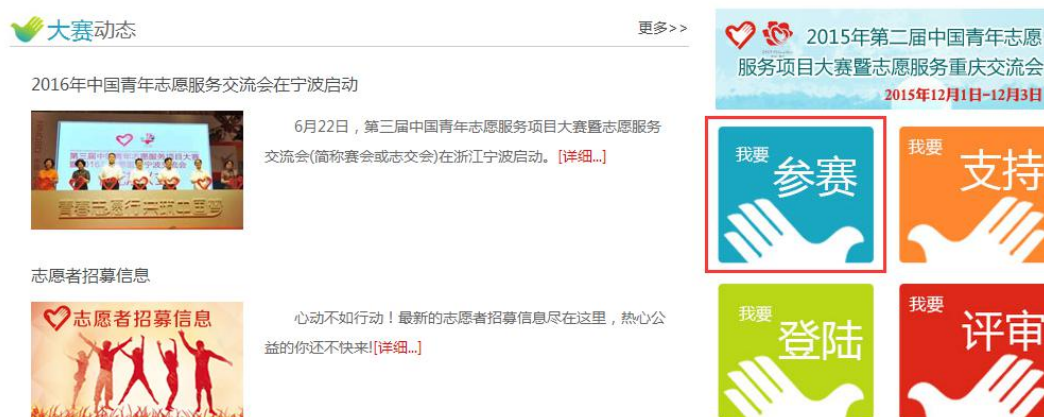
图 1 志交会官网主页链接界面

登录志交会官网： http://www.zhijh.cn 或 zhijh.youth.cn ， 点击“我要参赛”，进入项目大赛申报系统。