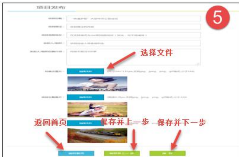
图 12 项目发布