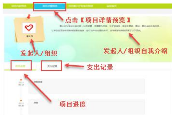
图 18 项目详情预览

第二步：点击“项目详情预览”，可查看项目的详细情况，包括发起人、项目进度和支出情况等（如图 18 所示）；