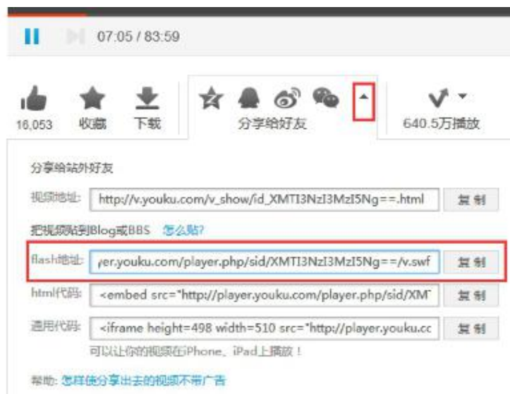
图 13 视频地址