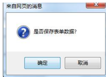
图 8 提示“是否保存表单数据”

第三步：填写项目基本信息。信息填写完整后，点击“保存并下一步”按钮（如图 9 所示），可保存本页面的信息并继续填写申报材料。