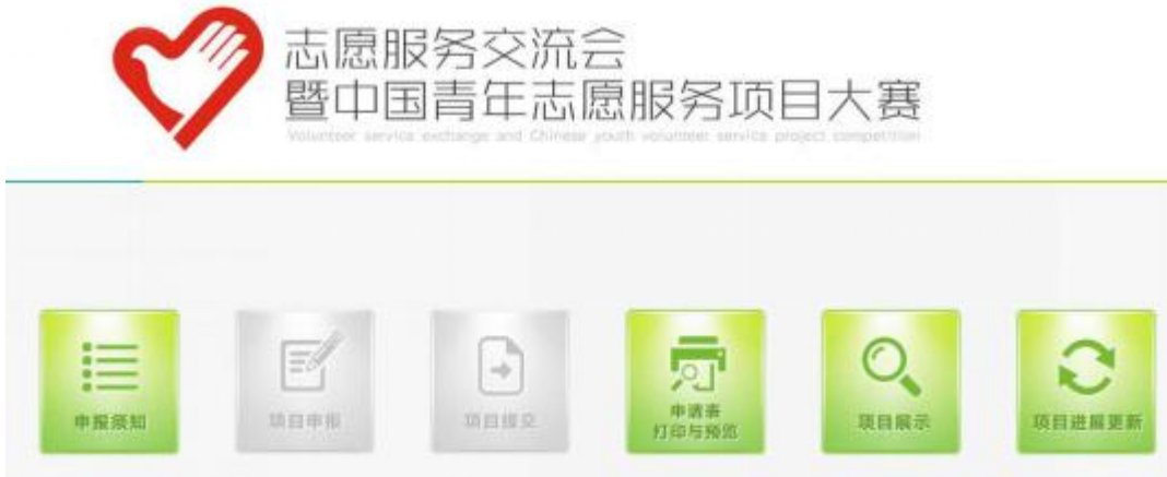
图 22 项目提交完成后主界面样式