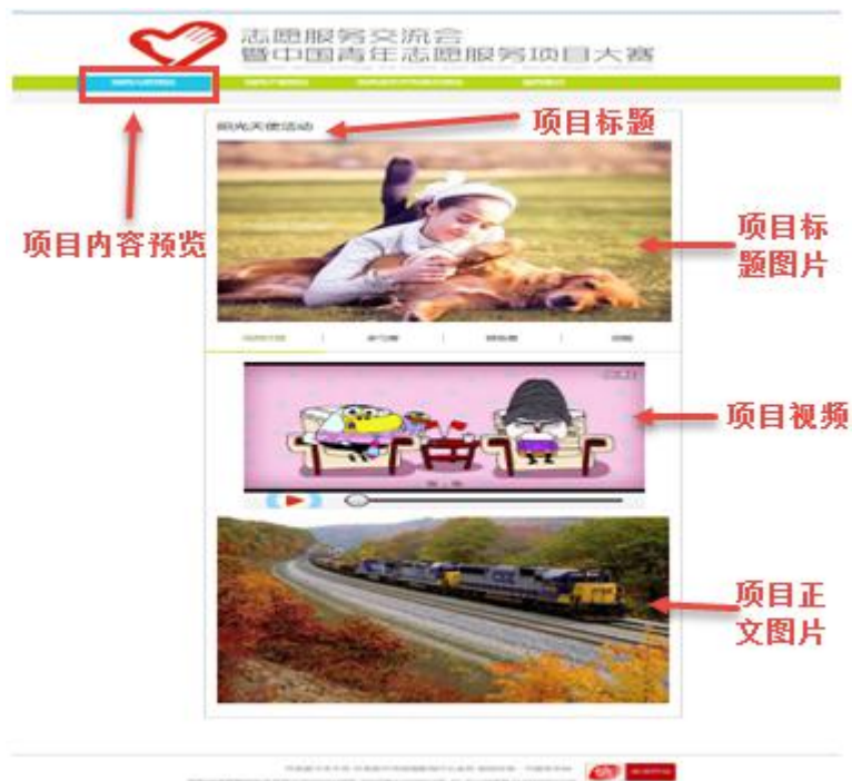
图 17 项目内容预览

第二步：点击“项目详情预览”，可查看项目的详细情况，包括发起人、项目进度和支出情况等（如图 18 所示）；