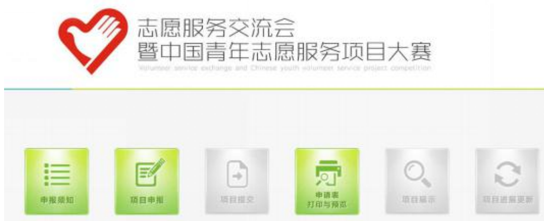
图 5 项目大赛申报系统主界面

用户未进行申报材料填写以前，【申报须知】、【项目申报】、【申报表打印与预览】这三个模块为可操作模块（呈绿色）。其它模块为不可操作模块（呈灰色），待项目申报材料填写完整后即可操作。