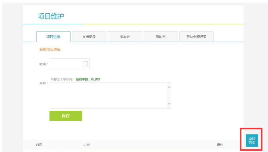
图 28 返回首页

注意：申报过程中出现技术问题，请加入第三届项目大赛交流群：484079082 进行咨询。