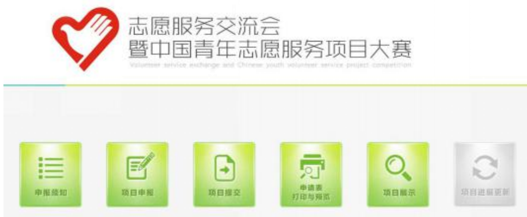
图 15 完成项目申报材料填写

注意：【项目申报】的内容填写完整并成功保存以后，才能在申报系统主界面进行【项目提交】等操作（如图 15 所示）。若发现【项目提交】按钮仍为灰色，请重新进入【项目申报】模块，查看所有资料是否填写完整。