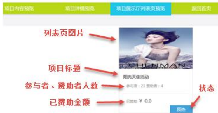
图 19 项目展示厅列表页预览