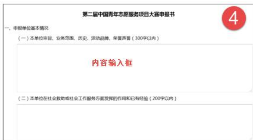
图 11 项目大赛申报书

注意：申报书的每一项内容都是必填项，且有相应的字数限制。若输入字数超过限制，则无法保存。