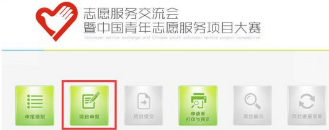
图 6 项目申报

第二步：填写申报单位基本信息（使用“管理信息平台”账号登陆的用户，系统将自动显示表格第一栏的“申报单位”内容）。信息填写完整后，点击“保存并下一步”按钮（如图 7 所示），可保存本页面的信息并继续填写申报材料。