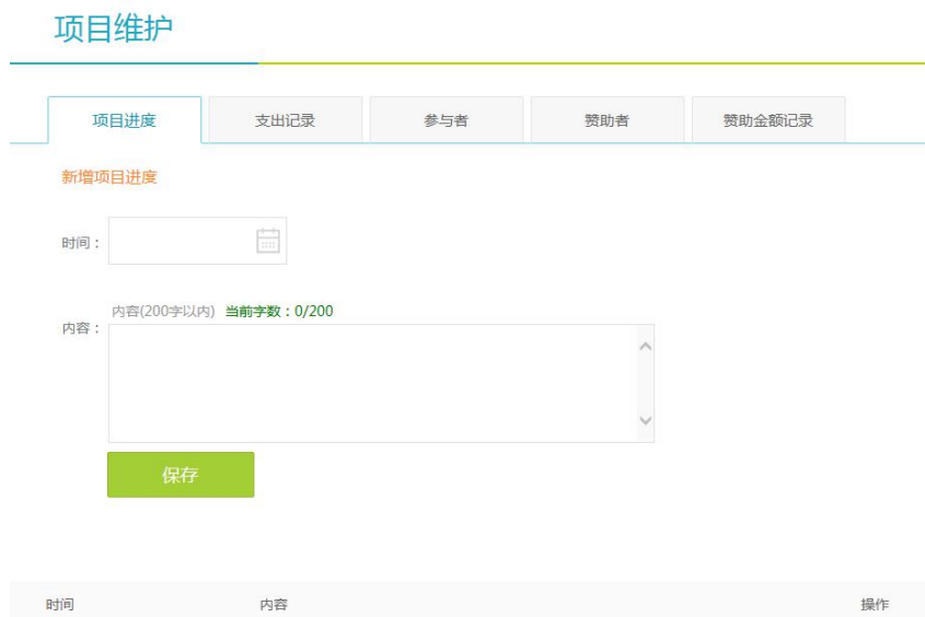
图 23 项目进度